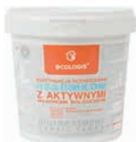
ECOLOGIS kontynuacja Codzienne użytkowanie, biodegraduje tłuszcze, eliminuje przykre zapachy

ŁATWY MONTAŻ NISKIE KOSZTY EKSPLLOATACJI