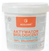
ECOLOGIS aktywator Na start i ponowne uruchomienie

ECOLOGIS- biopreparaty do każdej przydomowej oczyszczalni ścieków: