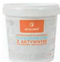
ECOLOGIS wspomaganie Codzienne użytkowanie